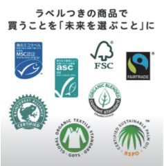
ラベルつきの商品で 買うことを「未来を選ぶこと」に

サステナブル・ラベル 社会的な持続可能な 社会の実現を促進し、 流通・消費の 的な生産・ りが、理論 です。サステナブル・ラベルを探 すことにより、みなさん一人ひと