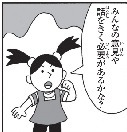
イラスト：倉橋達治