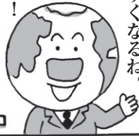
イラスト：倉橋達治

いろいろな立場の人が政治に参加することで、その人の立場の声を届けられるから、「誰ひとり取り残さない社会」も実現しやすくなるね。 他にどんなことができるか考えてみよう！