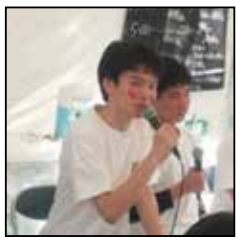
・オリョウ ・東京都 ・大学1年生

理由は、「つかう」ということは私たちの毎日の生活と深く関わっているので、私たちが少しづつでも頑張れば解決へと向かうことができるかもしれないからです。